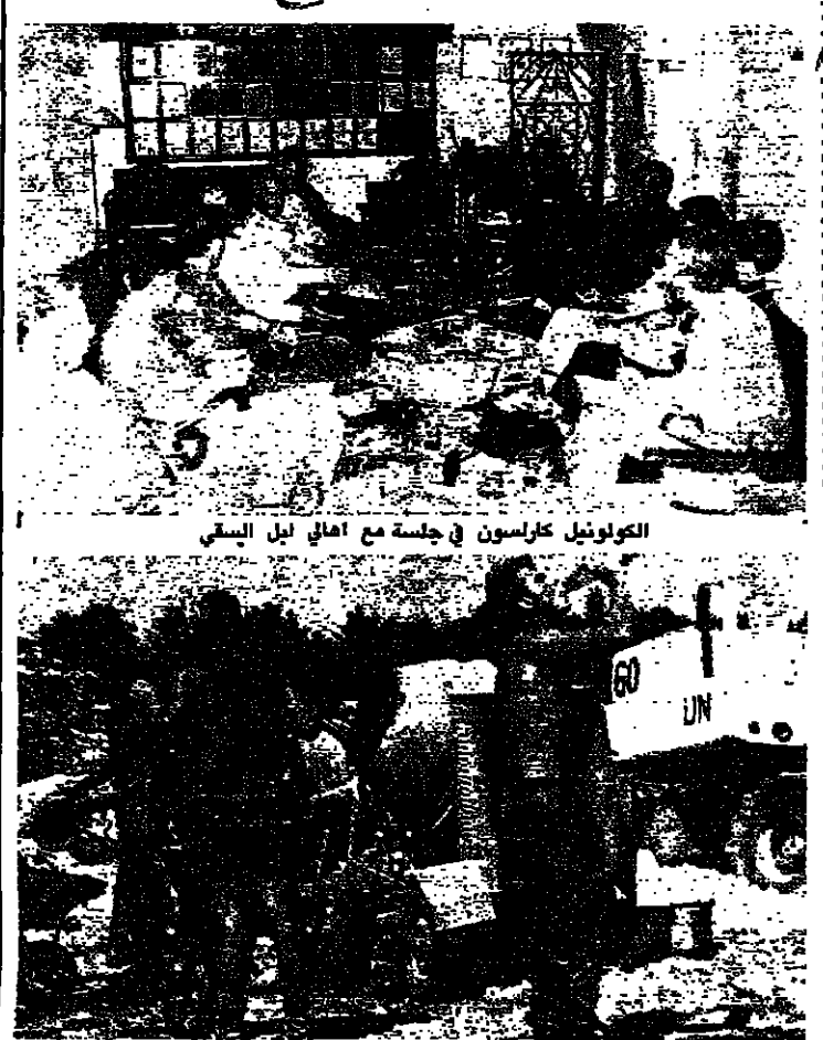
قوات دولية تنقل مراكز قياداتها الى خارج القرى

التي واخواتي الاعزاء. هكذا فهم لعنتي الحقيقي لجنود المسيح. ان لخذ الطبيعة البشرية بالنسبة اليه تعود الى هبة الذات وحبه للسلام والسعادة وايداع خلق الطبيعة في الانسانية. به تحولات المحبة حياة وليس السلام الثور. واكتسبت الوحدة نفسا جديدا والتوافق وجد طريقه. وبالمناسبة البنا نحن اليرمن. شعرتنا بوجوده على امتداد تاريخنا الطويل واليوم نرى ونشعر بوجود المسيح في ابداع شرايين حياتنا اليومية. ونخرج من الاطر الوطني الضيق لتفكي نظرة من العالم اجمع. فلسيد المسيح يشعروا بتجسده في حياة جميع الشعوب من دون تفرقة او تمييز بين العرق واللون. وفي بعض اثناء العالم يبدو هذا الوجود مؤثرا وفعالا اكثر من اثناء اخرى. واشهر في نهاية الالف الثاني من تاريخ المسيحية بلن الانسان رجلا وامارة اصبح اكثر شعورا وتقبلات لتأثير هذا الوجود. ففي كثير من بلدان العالم وبين عدد كبير من الاسم. فان النمو الاقتصادي والتكنولوجي والعلمي لم يتجذب في توفير الجواب الشافي للناس عن توفيق الوجودي الى السلام والسعادة. وفي مناطق اخرى. حيث الحروب والاضطرابات والاضغاط والاضغاطات والالام والفقر اصبحت مسيطرة وترسي قهقا على الشعوب في الاضغاط القوية.